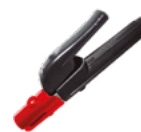
Pinza porta electrodos 300A