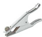
Pinza de masa 300A