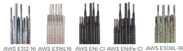
AWS E312-16 AWS E316L16 AWS ENi-CI AWS ENiFe-CI AWS E308L-16