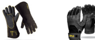
Guantes técnico MMA Expert Serie 14" EP123