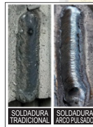
Comparativa de soldadura