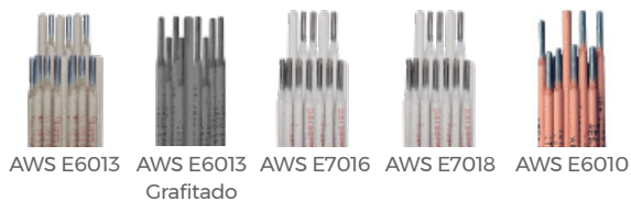
AWS E6013 AWS E6013 Grafitado AWS E7016 AWS E7018 AWS E6010