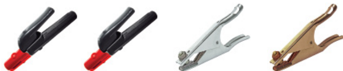
Pinza porta electrodos abierta 300A