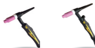
Antorcha TIG FUTURA 17m